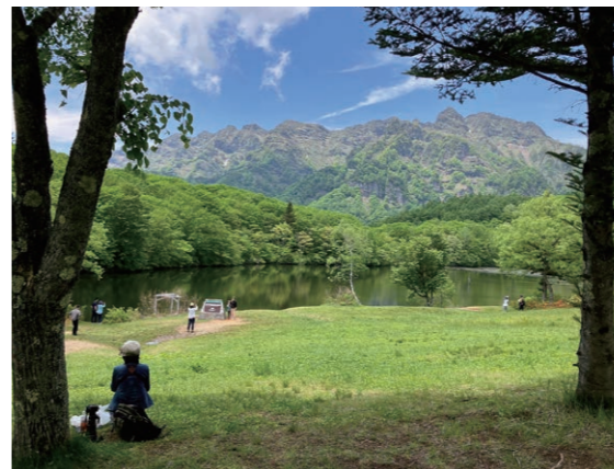
鏡池(長野市戸隠) 池に映る力強い戸隠山は絶景!