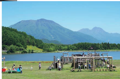
霊仙寺湖(飯綱町) “一目五山”を見ながら広大な芝生広場で遊ぼう!

ひとめござん 一目五山 この国立公園には噴火や隆起など色々な山が密集しており、でき方が違えば形も様々。そんな「個性的な形の山が一目でいくつも見える」当国立公園ならではの絶景のことです。