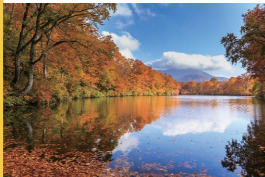
鎌池(小谷村) ブナの原生林に行む静寂な池が、駐車場からすぐ!