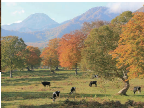
笹ヶ峰牧場(妙高市) 高原の風に吹かれ、草を食む牛に癒される