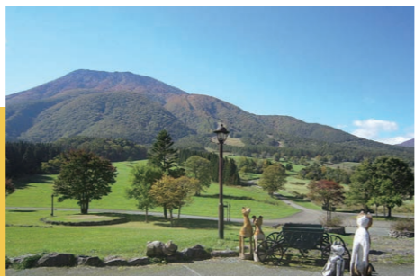
黒姫高原(信濃町) これぞ“高原”の風景、ここにあり!