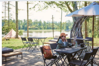
大座法師池(長野市飯綱高原) カフェやアスレチックでのんびり時間