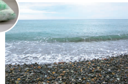
ヒスイ海岸(糸魚川市) いろんな石が転がる海岸では、 ヒスイが見つかるかも