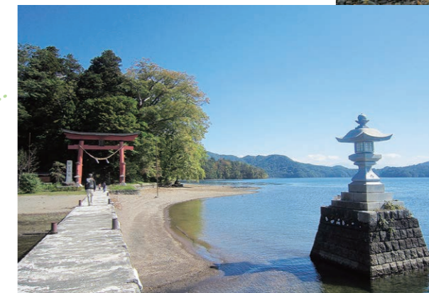
野尻湖(信濃町) 船で行く神社とナウマンゾウ発掘の湖