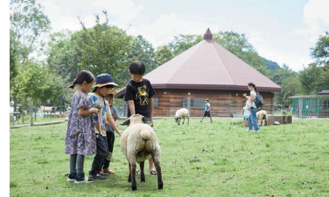
戸隠牧場(長野市戸隠) 戸隠山の麓でのびのび暮らす動物たち