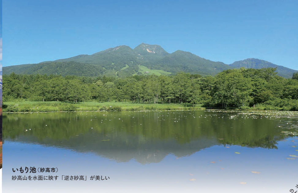
いもり池(妙高市) 妙高山を水面に映す「逆さ妙高」が美しい