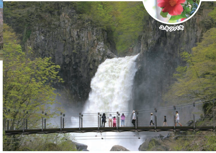
苗名滝(妙高市・信濃町) 轟音をたてて流れる雪解け水