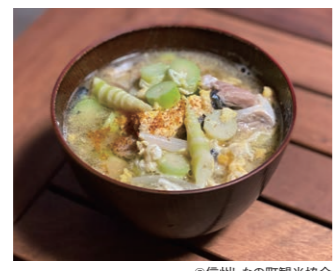
タケノコ汁 北信地域と新潟県上越地域の郷土料理。チシマザサの新芽にサバ缶を入れた味噌汁。