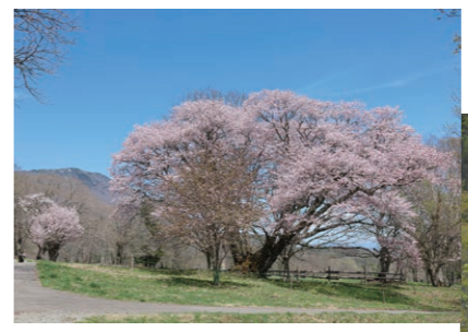
五地藏桜(長野市戸隠) 戸隠牧場を彩る一本桜