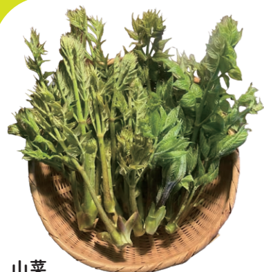
山菜 豊かな自然が広がる国立公園の周りでは、地域 や時期によって様々な山菜料理を楽しむ。