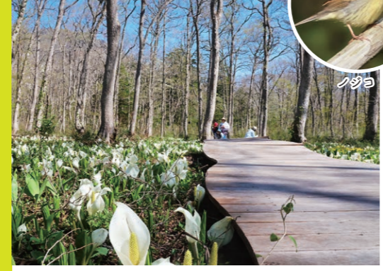
戸隠森林植物園(長野市戸隠) 花畑に響く小鳥のさえずり