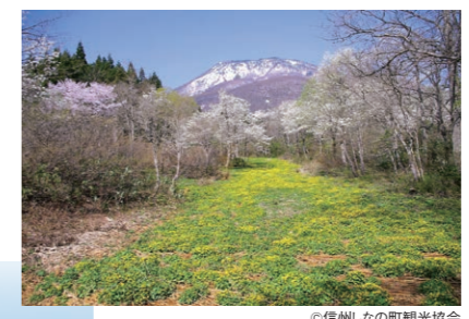
御鹿湿原(信濃町) コブシとリュウキンカの競演