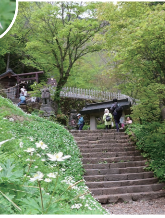
戸隠神社奥社(長野市戸隠) 参道脇に広がるニリンソウ

ひとめござん 一目五山 この国立公園には噴火や隆起など色々な でき方の山が密集しており、でき方が違 えば形も様々。そんな「個性的な形の山 が一目でいくつも見える」当国立公園な らではの絶景のことです。