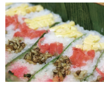
笹寿司 笹の葉の上に酢飯をのせ、具材や薬味を盛り付けた郷土料理。笹の防腐効果を生かした戦国時代の保存食ともいわれる。