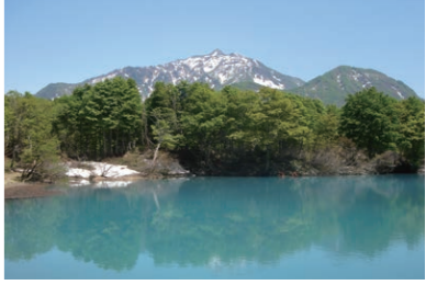
白池(糸魚川市) 白い色の水面には残雪の雨飾山が映ります