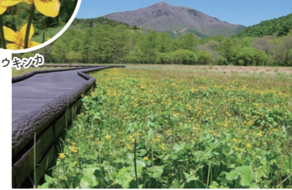
大谷地湿原(長野市飯綱高原) リュウキンカの黄色い絨毯