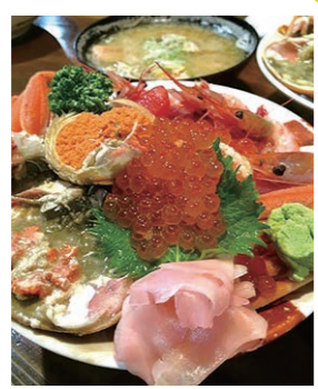
ジオ丼 糸魚川産コシヒカリを使ったどんぶりに、「世界ジオパーク」に認定された糸魚川で採れた海や大地の恵みを贅沢に盛り付け、各店が独自に創作。