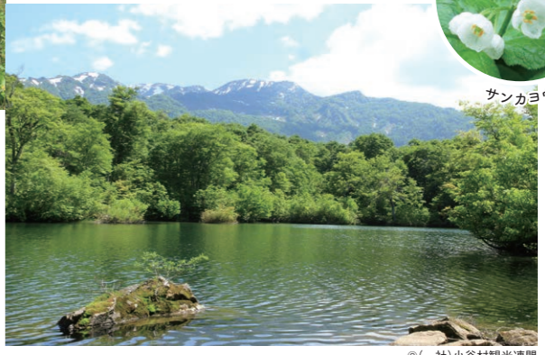
鎌池(小谷村) ブナ原生林の新緑