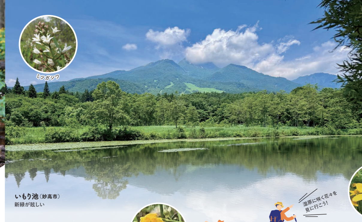
いもり池(妙高市) 新緑が眩しい