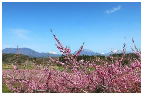
飯綱町丹霞郷から眺める、国立公園の山並み「一目五山」