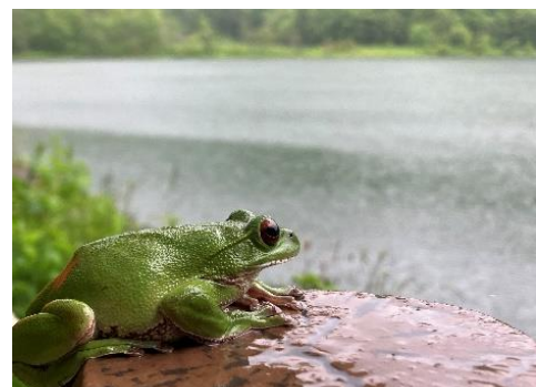
妙高戸隠の豊富な雪解け水が様々な生き物を育む